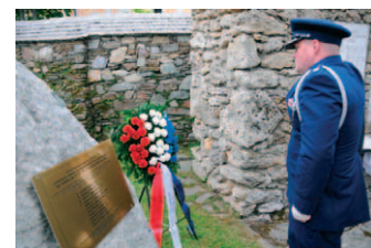
Der amerikanische Offizier vor dem Gedenkstein