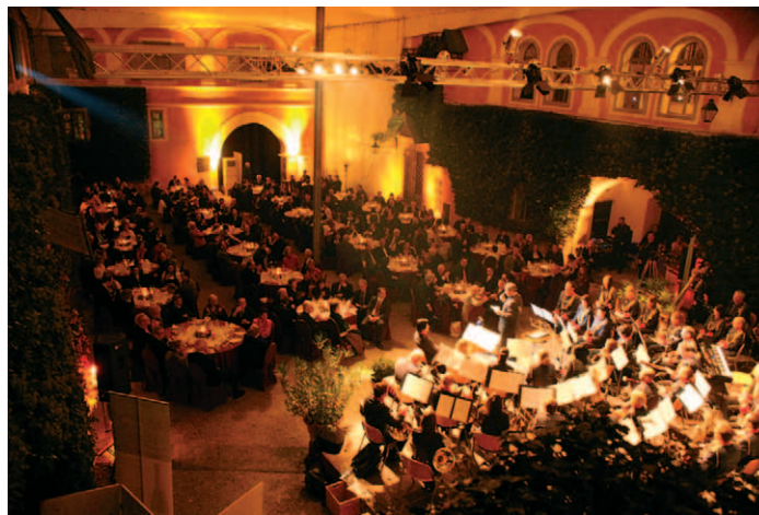
Der GALAABEND auf Schloss Birkenstein erstrahlt in neuem Glanz und bildet den krönenden Abschluss des Kulturhighlights des Jahres 2011.