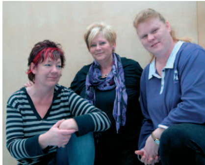
Das Team der Chance B Heimhilfe kommt zu Ihnen nach Hause und unterstützt Sie bei täglichen Arbeiten.