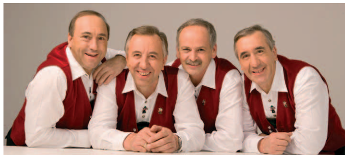
Die Stoakogler - sind mehr als 40 Jahre auf der Bühne gestanden, wurden mit ihrem Riesenhit „Steirermen san very good“ weltbekannt!

Was Großstädter von ihrer Gemeindeverwaltung verlangen, geschieht in einer so kleinen, gut funktionierenden Gemeinde oft