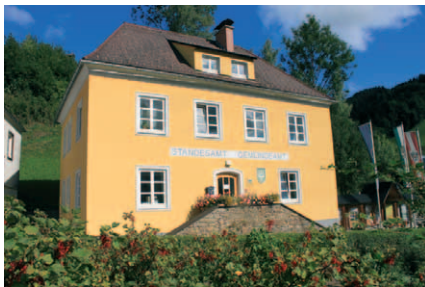
Standesamt und Gemeindeamt Gasen

Abseits der großen Verkehrsströme des Landes in einer Seehöhe von 800 bis 1500m in einem Seitental der Feistritz liegt Gasen mit nicht ganz 1000 Einwohnern. Ganz allgemein würde man aus einer solchen Situation sofort daraus schließen, dass es sich um ein Abwanderungsgebiet in dem nur noch ältere Menschen leben handelt. Weit gefehlt. Das Bergbauerndorf, mit einer Gemeindefläche von 3400 ha zeigt, dass es auch anders sein kann. Es weist eine Vielfalt von Gewerbebetrieben und Nahversorgern auf: einen Arzt mit Hausapotheke, 2 Kaufhäuser, eine Tankstelle, 2 Frisöre, Tischler, Stiegenbauer, ein Unternehmen für Elektro und erneuerbare Energie, einige Gasthöfe und Beherbergungsbetriebe, ein Tonstudio und ein EDV Unternehmen, einen Installateur, eine Raiffeisenbank, mehrere Holzschlägerungsunternehmen, eine Sportanlage, 2 Kinderspielplätze, ein Freibad, einen Kindergarten und eine Volksschule und 2 Biomasseheizwerke, die den ganzen Ort mit Fernwärme versorgen. Besonders bemerkenswert ist, dass der Anteil der Bewohner unter 20 Jahren bei 26,1 % liegt. Das ist der höchste Wert im Bezirk Weiz.