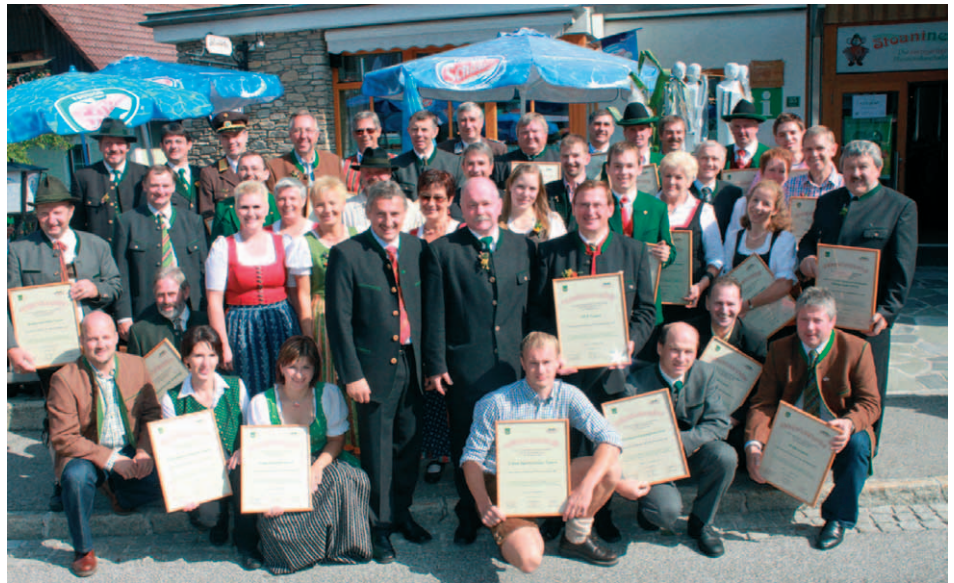
Die Gemeinde Gasen bedankt sich bei den Gasener Vereinsobleuten und beim Gemeinderat für die ehrenamtliche Arbeit.

Zu verdanken ist das hauptsächlich den tüchtigen Gewerbetreibenden, die in den letzten 15 Jahren rund 100 zusätzliche Arbeitsplätze geschaffen haben und ganz wesentlich auch der Eigeninitiative und dem Zusammenhalt der Bevölkerung. Unter den Gewerbetreibenden ist in erster Linie die Firma Willingshofer zu nennen. Der Maschinenbaubetrieb mit seinen über 60 Mitarbeitern und 10 Lehrlingen, die durchwegs aus der Region stammen, zeigt, dass man auch abseits großer Zentren einen gesunden Betrieb führen kann. Freilich sind dazu flexible Geschäftsführer und hochqualifizierte und engagierte Mitarbeiter nötig. Die moderne Fertigungstechnologie und der Sondermaschinenbau sind weit über die Grenzen bekannt. Gleichzeitig ist der Betrieb einer