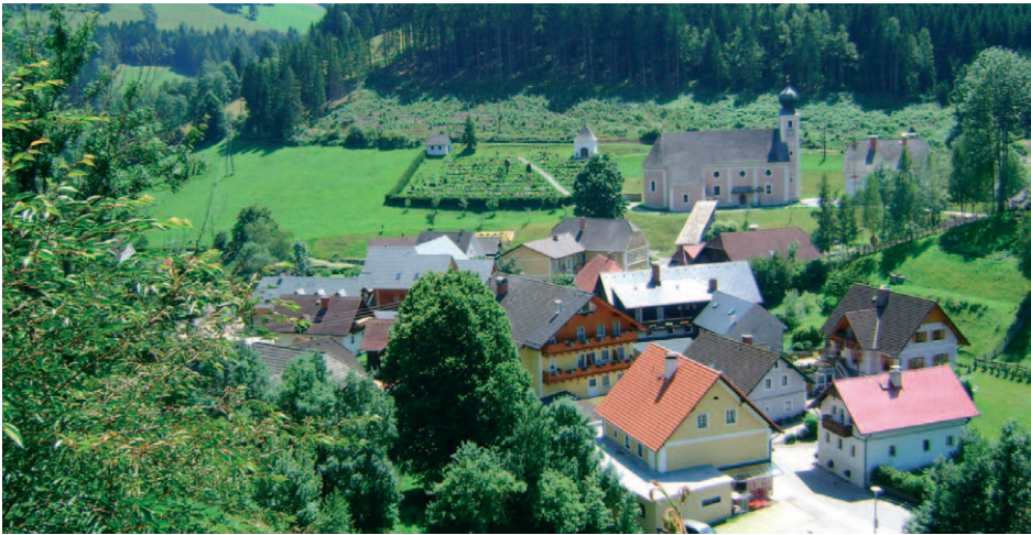
Gasen: Idyllisches Bergdorf und doch innovative Vorzeigegemeinde