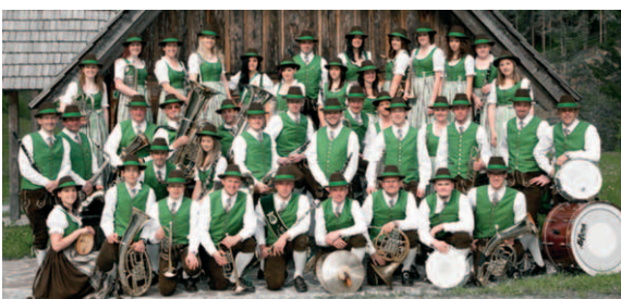
Musikverein Gasen: 42 aktive Mitglieder - gegründet 1898

Mit diesem Bundessieg sicherten sich die jungen Oststeirer das Ticket für die European Rallye, einem europaweiten Landjugend-Wettbewerb.